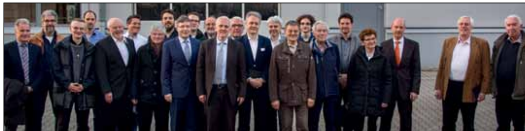
Konstruktives Treffen von der ATWW und dem VDE Rhein-Ruhr bei der Dortmunder Firmengruppe Beimdick

Am 23. März 2017 fand eine Begegnung der VDE Zweigstelle Dortmund mit der Arbeitsgemeinschaft Technisch Wissenschaftlicher Vereine (ATWW) in Dortmund statt. 23 Teilnehmer trafen sich in den Räumen der Dortmunder Firmengruppe Beimdick und tauschten sich angeregt über die Verbandsarbeit aus: Welche Exkursionen und Vorträge sind interessant? Wie