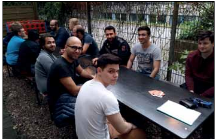
Gute Stimmung beim neuen Stammtisch der HSG Duisburg-Essen

schlossen, sich viel unterhalten und gelacht. Die Aktiven der Hochschulgruppe freuen sich über den rundherum gelungenen Start und hoffentlich viele weitere Stammtische in Duisburg. Stammtisch an jedem 2. Donnerstag, Infos unter jens.hussmann@stud.uni-due.de