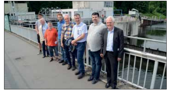
Bei bestem Wetter besuchte die Gruppe das Wehr und Kraftwerk Kemnade

nutzt. Dabei kommt eine Kaplan-turbine mit einer senkrechten Welle und einer Bemessungsleistung von 677 kW bei einer Ausbaumas-sermenge von 35 m 3 /s zum Einsatz. Beeindruckend ist auch der hydraulische Antrieb der Wehrklappen. In Abgrenzung zu einer Talsperre (Speicherung großer Wassermengen) hat ein Stauwehr in der Wassermengewirtschaft die Aufgabe, die Fließdynamik einer Hochwasserwelle zu reduzieren. Unter dem Gesichtspunkt der Wassergütwirtschaft wirken die Stauseen aufgrund der Reduzie-