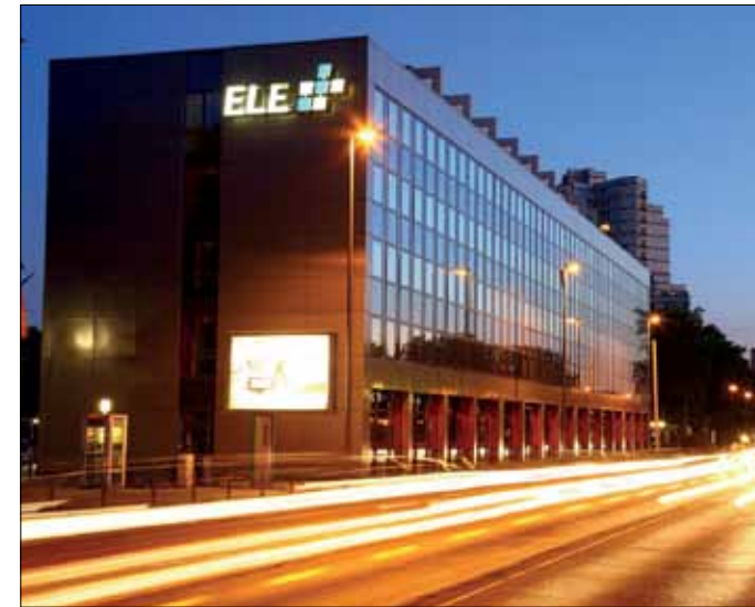
Während in der Hauptverwaltung der ELE-Gruppe an der Gelsenkirchener Florastraße organisatorisch die Fäden der Energieversorgung im Emscher-Lippe-Land zusammenlaufen...

Bitte beachten Sie auch unsere Ankündigungen unter www.vde-rhein-ruhr.de sowie die Veranstaltungen des ATWV unter www.atwv.de