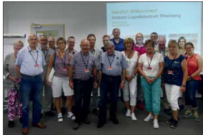
Die Gruppe wurde herzlich im Amazon Logistikzentrum empfangen

tiv beste Ware zum Kunden adressiert,“ heißt es beim Amazon Logistikzentrum. Keine leichte Aufgabe bei 300.000 Pakete pro Tag und bei 650.000 im 4. Quartal, eine große Herausforderung für die gesamte Belegschaft! Dreh- und Angelpunkt ist natürlich die Lager- und Regalorganisation, die von der Artikelgröße, dem Gewicht, der Zugriffshäufigkeit und der Sortimentsvielfalt abhängt. Bemerkenswert ist dabei unter anderem, dass einerseits ähnliche Artikel in räumlicher Distanz und nicht in benachbarten Regalplätzen liegen und andererseits in einem Regalplatz bis zu fünf verschiedene Artikel zu finden sind. Stets durchläuft der Warenstrom die Stationen und Bearbeitungsschritte: „Recieve > Stow > Pick > Pack“, danach erfolgt die Übergabe an einen Zusteller, in Rheinberg meist an das benachbarte DHL Paket Sortier Center, das anschließend besichtigt werden konnte.