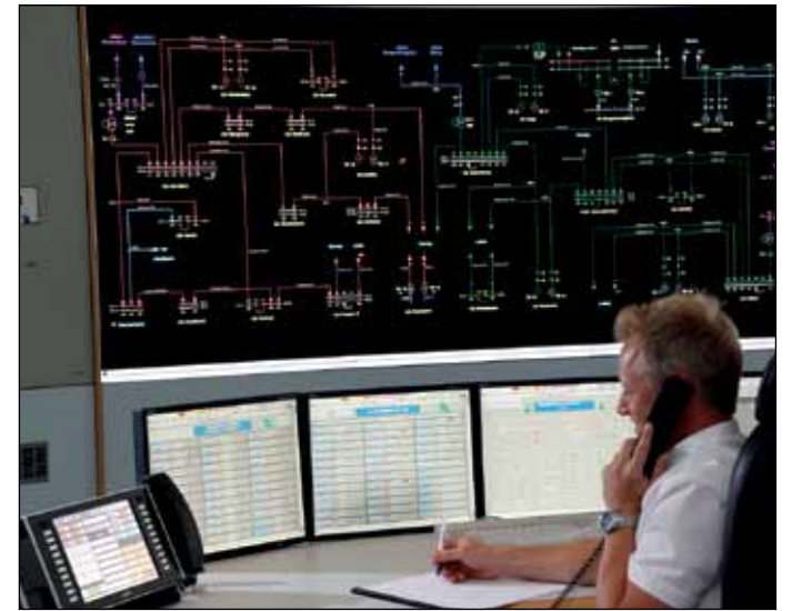
...schlägt das technische Herz der Strom- und Gasnetz in der Gladbecker Netzleitstelle. Hier wird rund um die Uhr für die Sicherheit der Energieversorgung Sorge getragen.