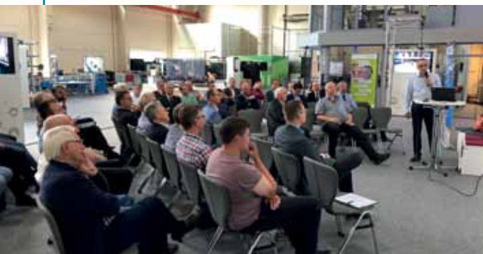
Das Symposium IT-Sicherheit im Fraunhofer-Institut Dortmund