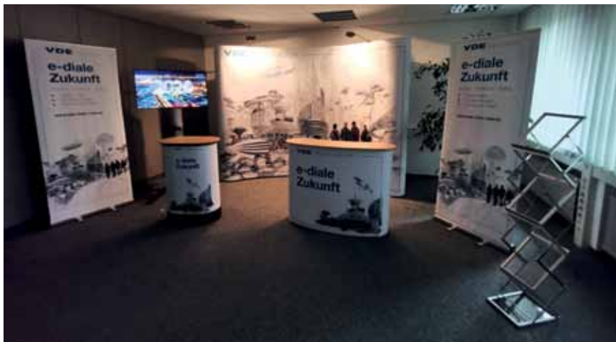
Der neue Messestand des VDE RR vollständig aufgebaut und zum Transport verpackt (Bild rechts)

Teilnehmerbeitrag: ca. 37 € (ohne Getränke)