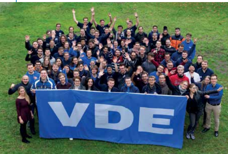
Die versammelten Teilnehmer des Jungmitglieder Ausschusses