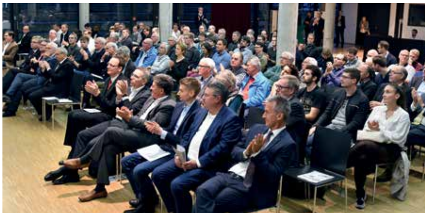
Referenten und Teilnehmer am 2. Energiediskurs

Los ging es um 16:30 Uhr mit der Möglichkeit verschiedene elektrisch angetriebene Fahrzeuge anzusehen und Probe zu fahren. Neben vollelektrisch angetriebenen Fahrzeugen konnten Fahrzeuge mit Plug-in und Voll-Hybrid Technologie sowie ein Fahrzeug mit Wasserstoffantrieb betrachtet werden. Letztere stellte sich im Laufe des Abends als eine Technologie heraus, die viele Diskussionsmöglichkeiten bietet und die Frage offen lässt, ob nun die Wasserstoff-, die Batterietechnik oder eine Mischung aus beidem die Zukunft ist. Schirmherren der Veranstaltung wa-