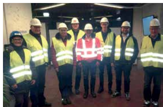
Die Zweigstellenmitglieder im MKHW Essen