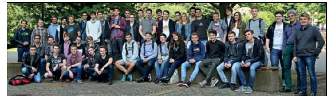
Die Schülerinnen und Schüler des Recklinghäuser Hittorf Gymnasiums besuchten verschiedene Institute der TU Dortmund

Bereits zum vierten Mal unterstützte der VDE Rhein-Ruhr den jährlichen MINT-Exkursionstag des Hittorf-Gymnasiums aus Recklinghausen. Im Juni machten sich rund 40 Schülerinnen und Schüler der Jahrgangsstufe 11 auf den Weg nach Dortmund, um dort auf dem Campus der Technischen Universität einen spannenden und informativen Tag zu erleben. Die VDE Zweigstelle Dortmund und die Hochschulgruppe Dortmund hatten dafür einige Institute gewinnen können, die ihre Türen öffneten und gerne Einblick in Lehre und aktuelle Forschung gaben. Kommunikations- und Hochspannungstechnik, Mikro- und Nanotechnologie, aber auch Themen der Energiesys-