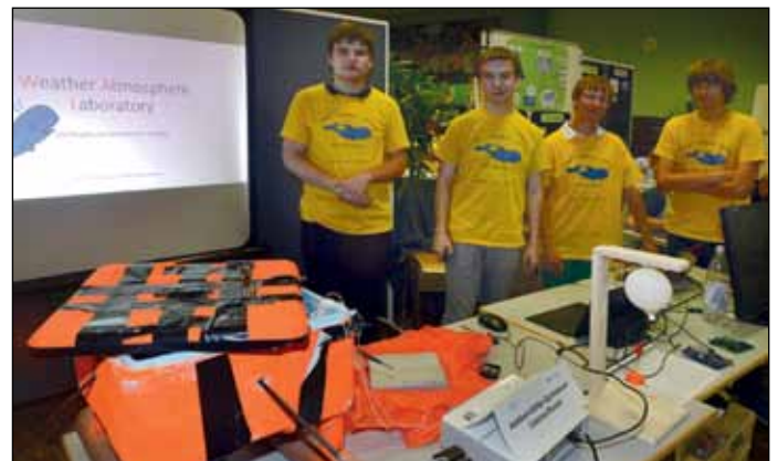
Komplizierter Aufbau, gelungene Präsentation: Das Team des Castrop-Rauxeler Adalbert-Stifter-Gymnasiums belegte mit dem Wetterballon den 1. Platz

das mit seinem Projekt „Schnittstelle Mensch + Maschine“ beeindruckte. Für die Entwicklung eines Handknochens, der mittel 3D-Druckverfahren hergestellt wird, erhielten die Waltröper dann auch noch den mit 500 Euro dotierten Ehrenpreis. Den 3. Platz belegte das Team der Recklinghäuser Maristenschule. Die Schüler der Jahrgangsstufen 6-8 entwickelten ein automatisches Bewässerungssystem für Gärten.