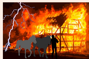
Brand und Explosion