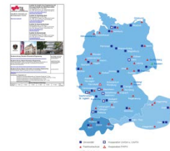
Übersicht BMT- Studiengänge