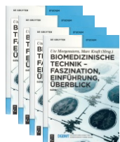
Lehrbuchreihe inkl. eBook