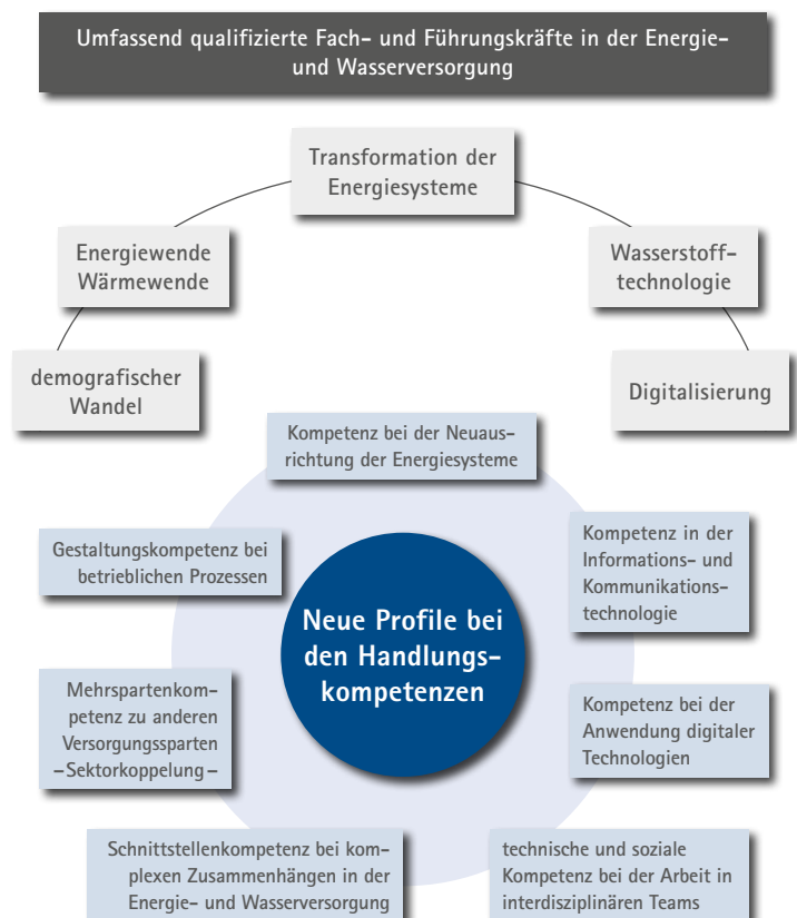
Abb. 2: Umfassend qualifizierte Fach- und Führungskräfte in der Energie- und Wasserversorgung

Die Digitalisierung und die damit ermöglichte Flexibilisierung der Arbeit stehen im Mittelpunkt vieler Qualifizierungsoffensiven. Neue Tätigkeiten entstehen, während andere verschwinden. Neue Tätigkeiten erfordern wiederum neue Kompetenzen, aus denen sich zukünftige Berufe bzw. Jobprofile zusammensetzen. Die Handlungskompetenzen in der digitalisierten Arbeitswelt erfordern von den Fach- und Führungskräften neben der Technikbeherrschung immer stärker auch organisatorische, medienpezifische und soziale Befähigungen.