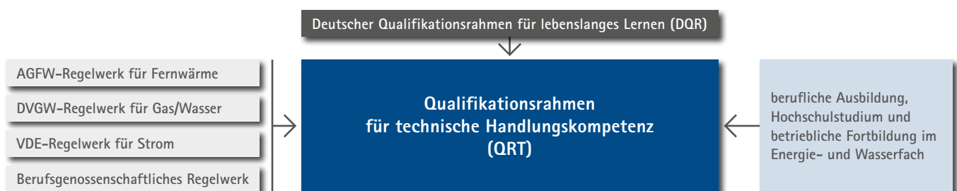
Definition der technischen Handlungskompetenz durch Normen und Regeln, DQR und QRT