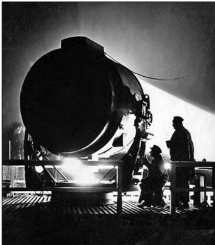
Beckscheinwerfer; Erfinder: Heinrich Beck, zusammen mit seinem Assistenten, Erich Koch, 1912 auf dem Dach des Physikalisch-technischen Laboratorium Meiningen beim Testen des ersten Scheinwerfer-Versuchsmodells.

1989 stellte das Kombinat Mikroelektronik Erfurt ein Funktionsmuster einer „echten“ 32-Bit-CPU vor.