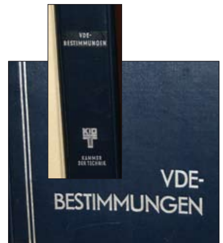
VDE-Vorschriftenordner der KDT.

Die Folien für den Vortrag stehen zum Download zur Verfügung (Infokasten).