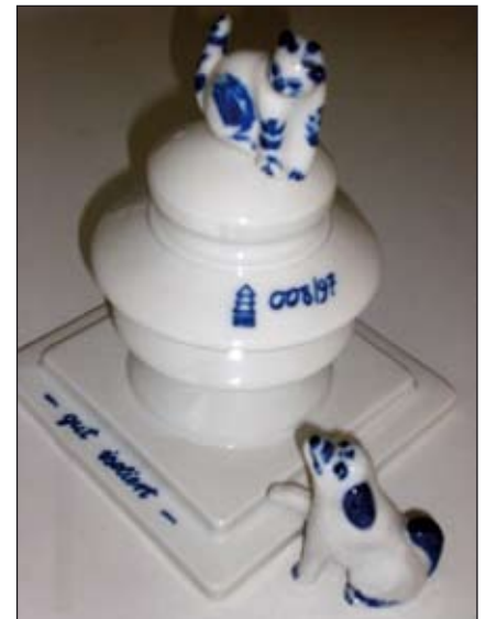
Delta-Isolator; Unikat angefertigt anlässlich des 100. Jahrestages.

Erwähnt werden soll hier auch die Rudolstädter Röhrenwerkstatt Ungelenk & Kiesewetter aus der 1920 die Phönix