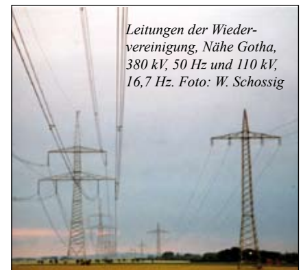
Leitungen der Wiedervereinigung, Nähe Gotha, 380 kV, 50 Hz und 110 kV, 16,7 Hz.